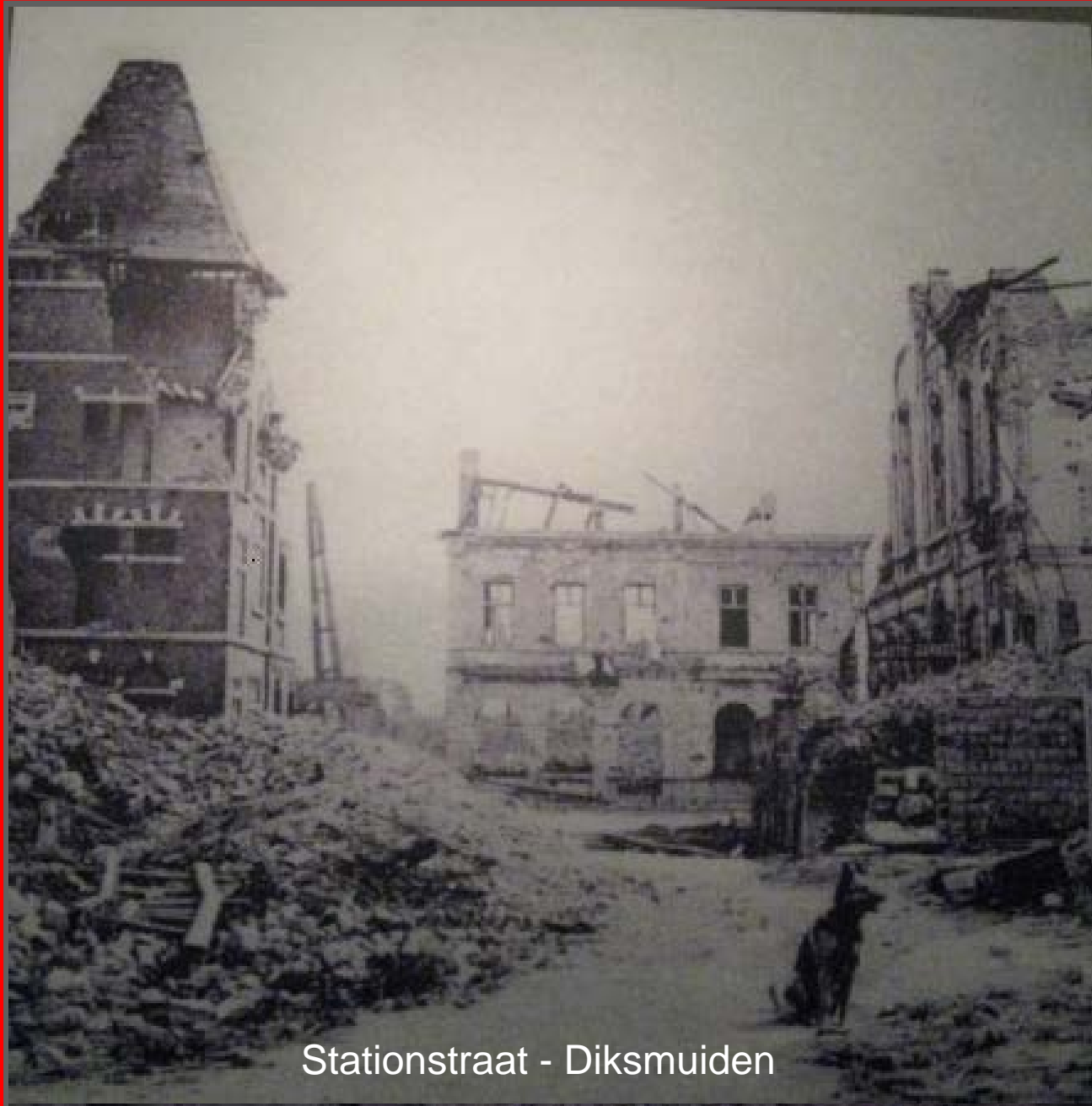
Stationstraat - Diksmuiden